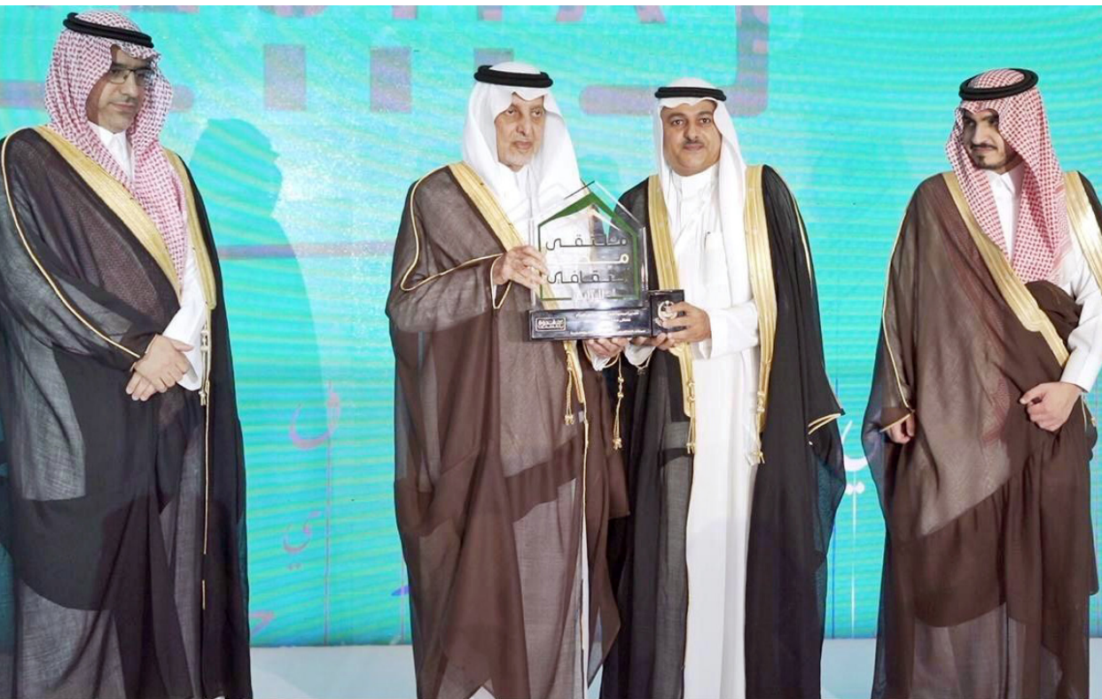
الفیصل مدشنا ملتقى مكة الثقافية أمس.

عنوان «كيف نعزز اللغة العربية؟» التي تهدف إلى تحفيز استخدام التقنية، وبناء شراكات فعالة مع المؤسسات العاملة في الشأن اللغوي.