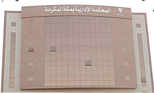
المحكمة الإدارية في منطقة مكة المكرمة.