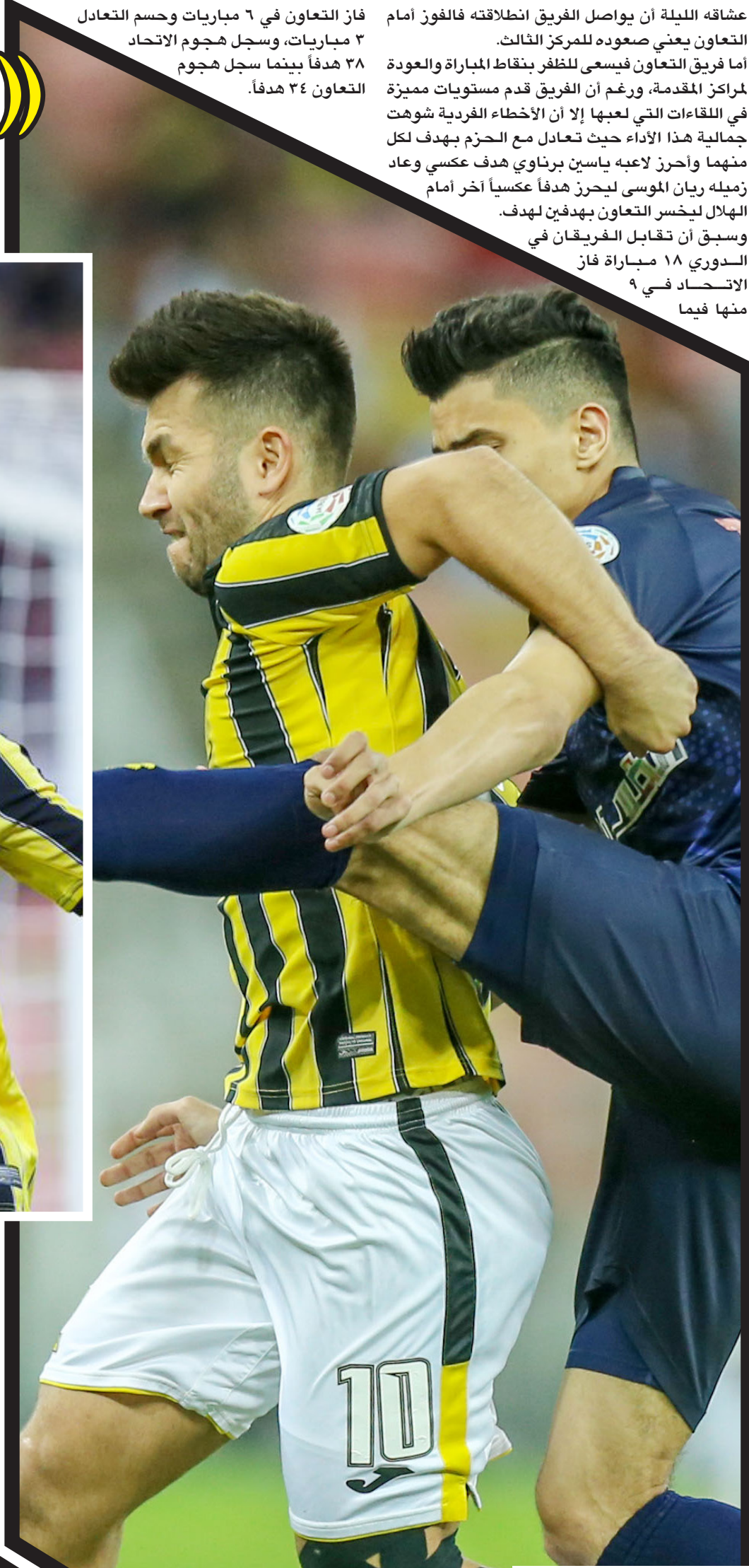
مواجهة منتظرة بين الطرفين.

يستضيف فريق الشباب على ملعبه وبين جماهيره مساء اليوم (الثلاثاء) نظيره شبعبة الساوره الجزائري في إياب دور ٣٢ لكأس محمد السادس للأندية الأبطال وذلك عند الساعة ٧:٤٥ على ملعب الأمير خالد بن سلطان بمقر النادي، بعد أن انتهى لقاء الذهاب في الجزائر بفوز الشباب بثلاثية مقابل هدف. يدخل فريق الشباب للقاء وهو المرشح الأقوى للتأهل للمرحلة الثانية بعد فوزه القوي في الذهاب، ويكفي الشباب التعادل للتأهل أو الخسارة بفارق هدف، ورغم الحظوظ القوية لشيخ الأندية السعودية