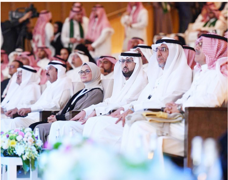
منع الزيوت المهدرجة بشكل كامل في ٢٠٢٠

أكد الرئيس التنفيذي للهيئة العامة للغذاء والدواء الدكتور هشام الجضعي، أن المملكة حققت زيادة عالمية في تعزيز صحة المجتمع، وتعد ممثلة بهيئة الغذاء والدواء- من أولى الدول التي تلزم محلات بيع العصائر الطازجة بعدم إضافة السكر إلى العصائر، وأول دولة عربية تطبق «تغليف التحذير الصحي» لمنتجات التبغ، وأول دولة على المستوى الإقليمي تلزم المطاعم والمقاهي بعرض السعرات الحرارية على قائمة الوجبات المقدمة في المنشآت الغذائية. ولغت خلال افتتاحه أمس (الاثنين)، فعاليات المؤتمر والمعرض السنوي الثالث للهيئة بعنوان «الشراكة مع المستهلك لحماية المجتمع» تحت رعاية وزير الصحة رئيس مجلس إدارة