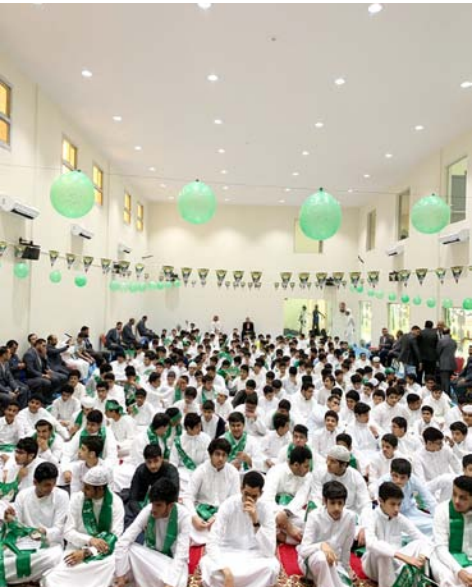
طلاب يشاركون في الاحتفال.