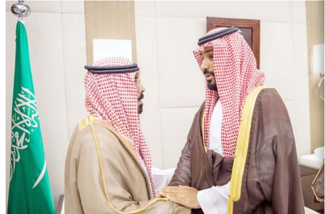
ولي العهد يقدم العزاء والمواساة لأسرة وذوي الفقيد المفخم خلال استقبالهم أمس، (واس)

بعث ولي العهد نائب رئيس مجلس الوزراء وزير الدفاع الأمير محمد بن سلمان بن عبدالعزيز، برفقيات تهنئة لكل من رئيس الصين الشعبية شي جين بينغ، ورئيس مجلس الدولة في الصين لي كيتشيانغ بمناسبة الذكرى السبعين لتأسيس الصين الشعبية، ورئيس نيجيريا الاتحادية محمد بخاري، ورئيس قبرص نيكوس اناستاسيادس، بمناسبة ذكرى استقلال بلاديها.