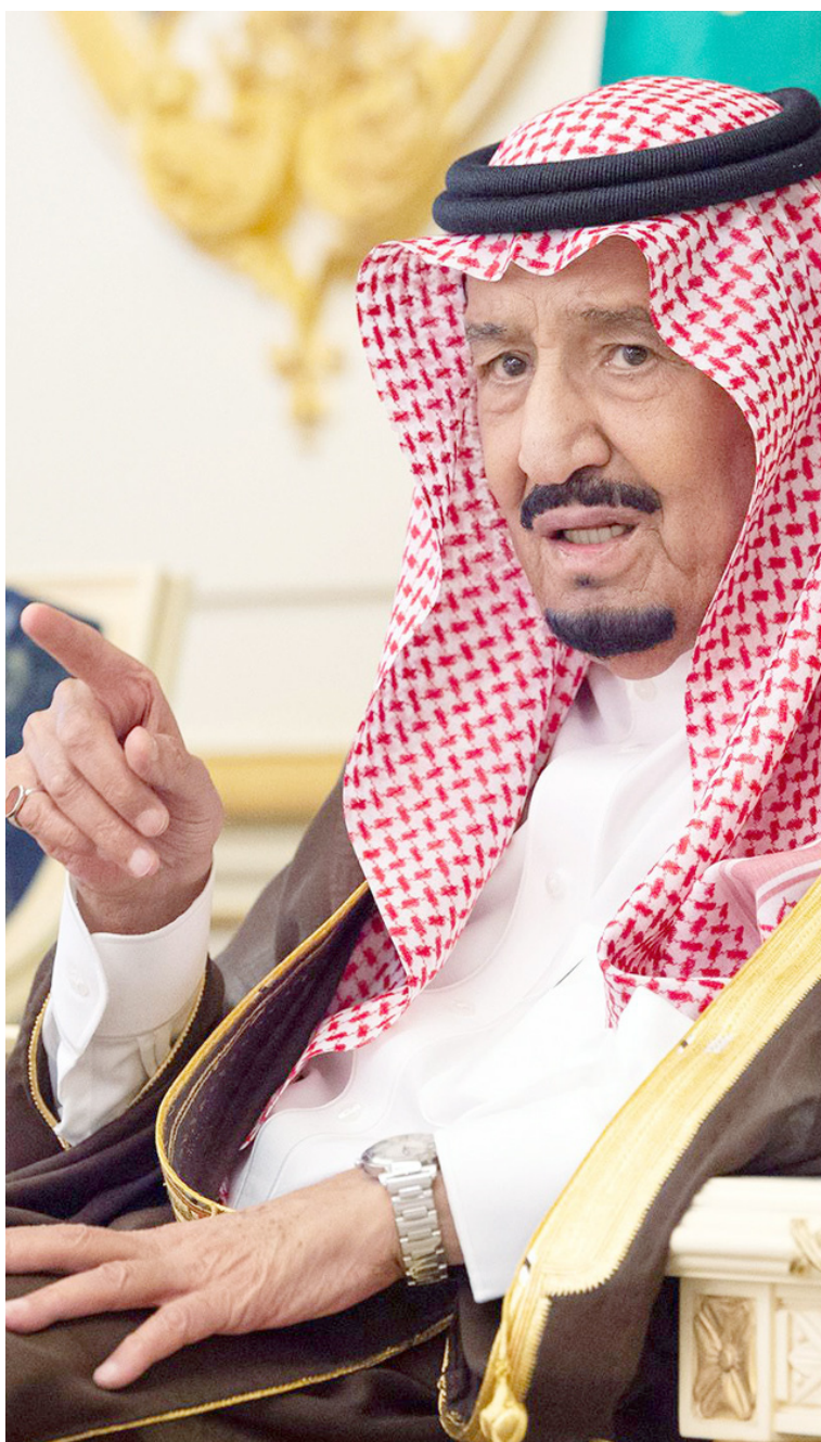
خادم الحرمين متحدثاً خلال اللقاء.