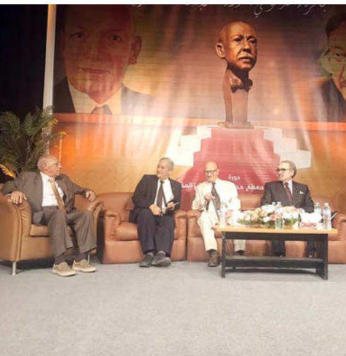
جانب من حفل جائزة شوقي.