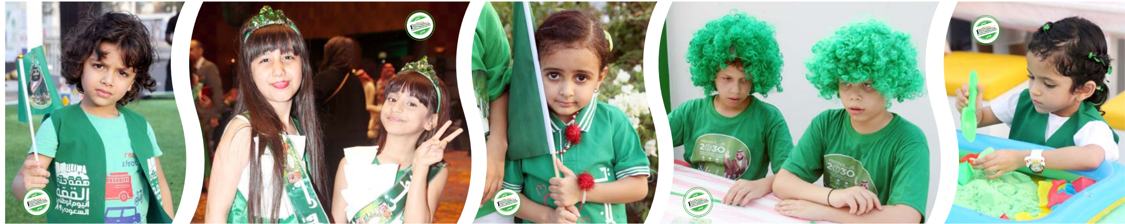
مجموعة من الأطفال يرتدون الملابس ويتزيّنون بالشعارات الوطنية خلال الاحتفالات باليوم الوطني السعودي في أحد ميادين مدينة جدة.