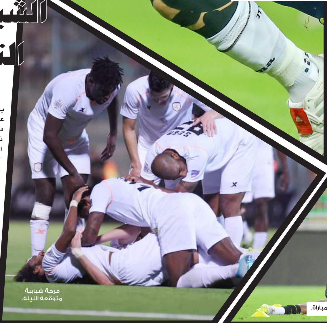
فرحة شبابية متوقعة الليلة.