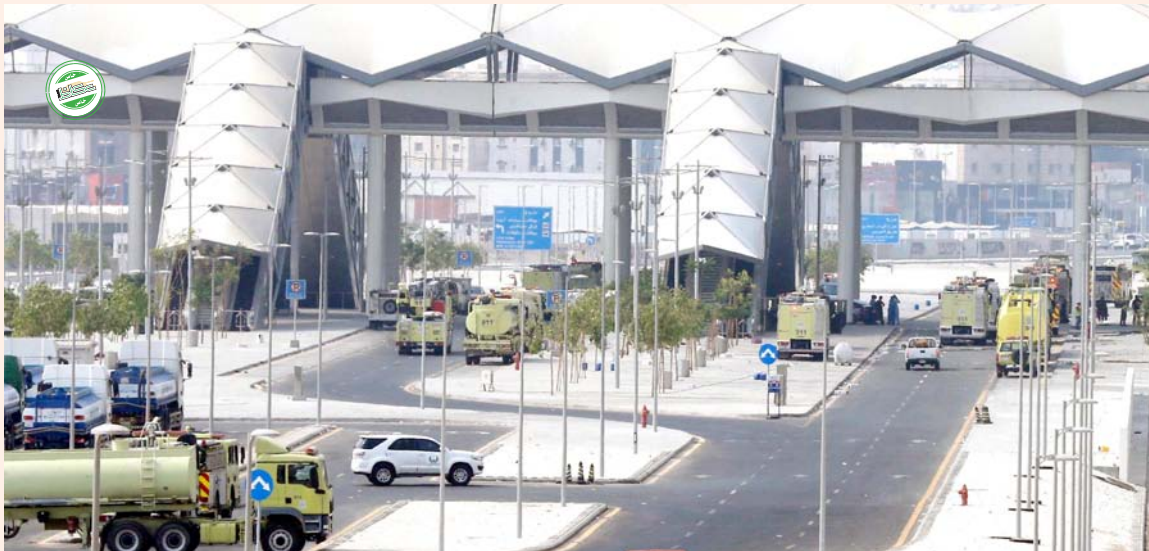
اليات الدفاع المدني ترابط في الموقع في اليوم التالي لحادثة اندلاع الحريق.

أظهرت جولة أمير منطقة مكة المكرمة الأمير خالد الفيصل ما لحق محطة السلیمانیة للقطار من أضرار كبيرة، وسيتوقف العمل بالمحطة الرئيسية خلال الفترة القادمة بعد انهيار أجزاء من سقف المحطة، واحتراق عدد من المكاتب الداخلية وأقسام التشغيل. وكشفت مصادر لـ «عكاظ» أن محطة القطار بالسلیمانیة يوجد بها مركز للدفاع المدني غير أنه لم يتم تجهيزه بعد، ويتوقع أن تشمل التحقيقات وسائل السلامة والإطفاء المتوافرة بالمحطة، بعد التأكد من عدم وجود خطر على أعضاء لجان التحقيق