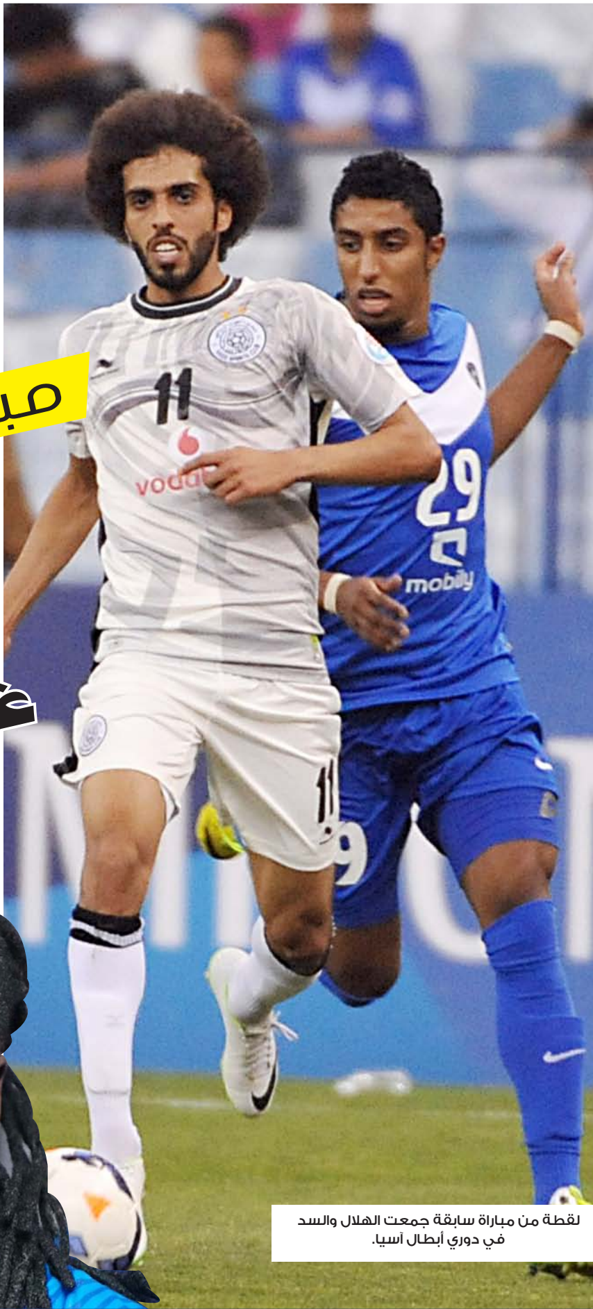
لقطة من مباراة سابقة جمعت الهلال والسد في دوري أبطال آسيا.

يشهد لقاء السد والهلال الذي سيقام مساء اليوم على ملعب السد ضمن ذهاب دور الاربعة من البطولة الآسيوية، صراعاً تهديفياً بين لاعب الهلال الفرنسي بافيتمبي غوميز، ولاعب السد الجزائري بغداد بونجاح، إذ يسعى كل مهاجم لإسعاد وزراعة الابتسامة على محيا جماهير فريقه التي تعول عليهم الكثير في هذا المنعطف الآسيوي. يذكر أن الكفة تميل لصالح مهاجم الزعيم غوميز كونه موجودا في قائمة الهدافين بأبطال آسيا بعد تسجيله ٧ أهداف منذ انطلاقة هذه البطولة في حين سجل بونجاح ٣ أهداف.