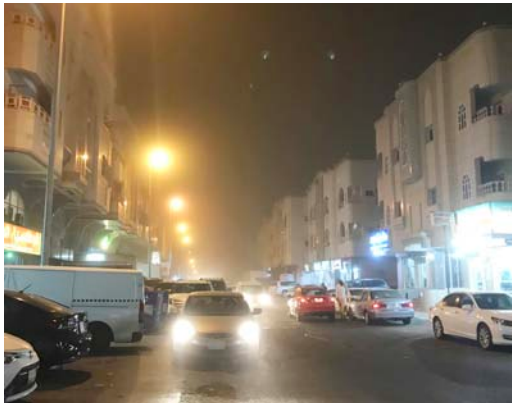
عوالق ترابية في جدة أمس.

أمتار رعدية من متوسطة إلى غزيرة مصحوبة برياح نشطة تحد من مدى الرؤية الأفقية على مناطق نجران، جازان، عسير، الباحة، مكة المكرمة والمدينة المنورة، ويمتد تأثيرها على الأجزاء الساحلية منها، في حين يتوقع تكون الضباب خلال ساعات الليل والصباح الباكر على جنوب غرب، وغرب المملكة.