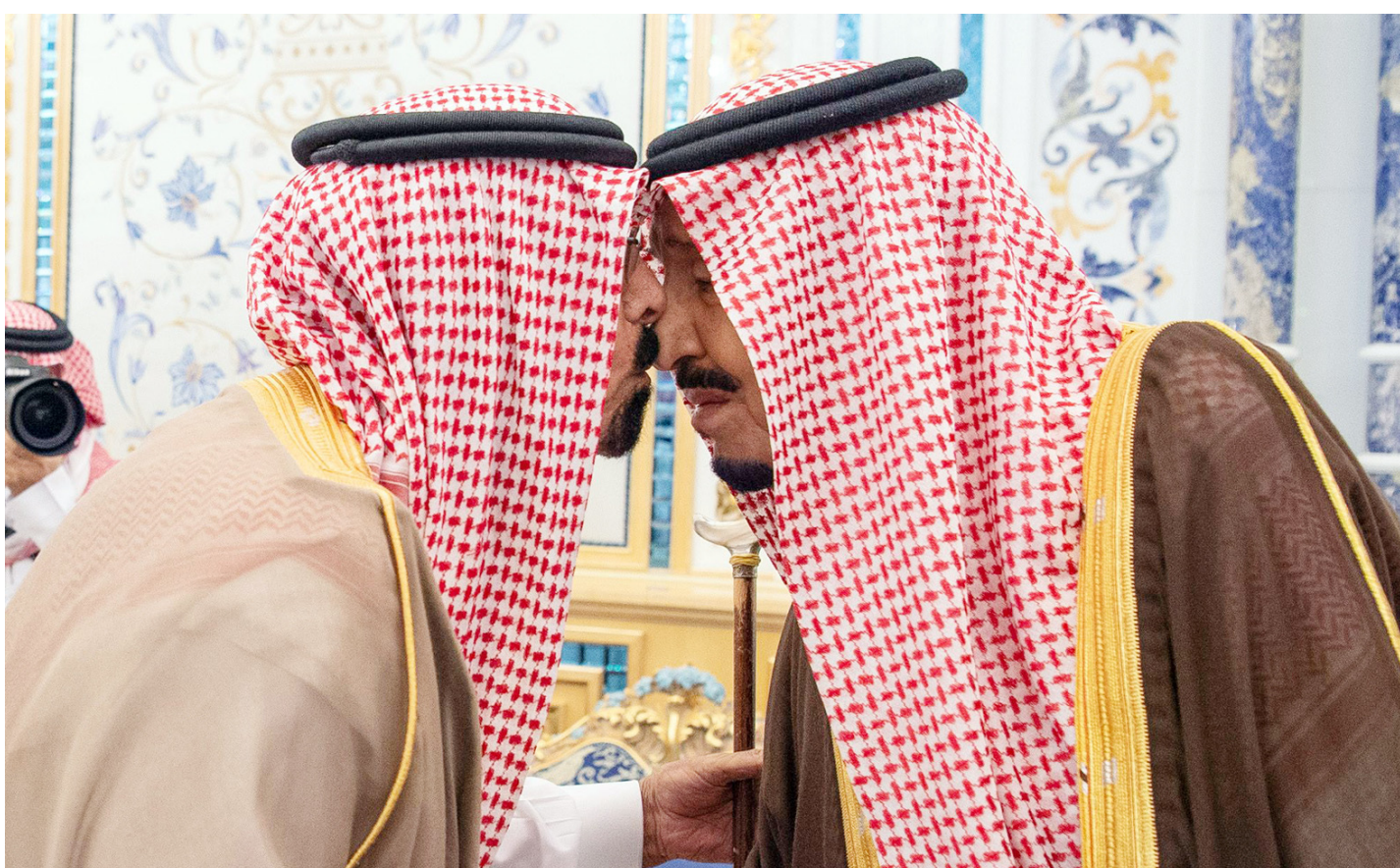
الملك ملتقيا بداح الفغم والد الشهيد.