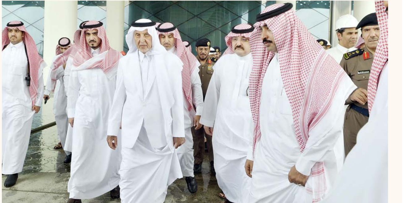
أمير منطقة مكة متفقدًا أمس (الاثنين) حجم الأضرار التي لحقت بمحطة قطار الحرمين، إثر الحريق الذي اندلع ظهر أمس الأول.

الحرمين بمحافظة جدة. وأكد الأمير خالد الفيصل خلال وقوفه ميدانياً أمس (الاثنين) على الأضرار التي لحقت بمحطة قطار السلیمانیة أن نتائج التحقيق الذي ستشارك فيه وزارتا الداخلية، والنقل، وإمارة مكة سترفع للمقام السامي للإطلاع والأمر بما يراه خادم