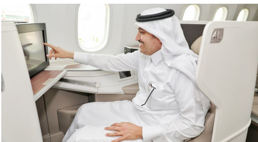
الجاسر داخل أول طائرة من طراز بوينج (B787-10)

مقعداً لدرجة الضيافة و٢٤ مقعداً لدرجة الأعمال جرى تجهيزها بالكامل بأحدث وسائل الراحة وتقنية الاتصالات التي تجعل السفر على متنها سهلاً وممتعاً.