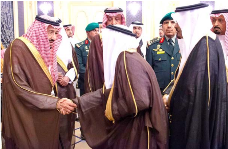
.. ومصافحا آخر.