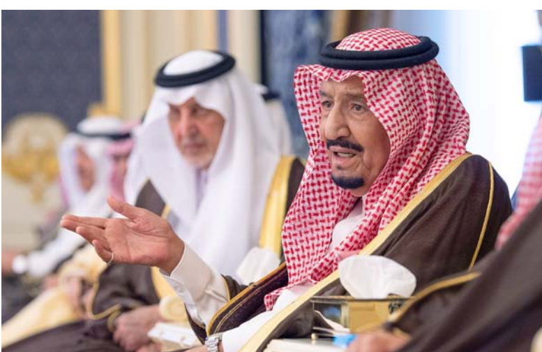
.. وبجواره الأمير خالد الفيصل.