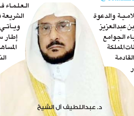
د. عبداللطيف آل الشيخ

من الناحية الشرعية، وذكر فتاوى هيئة كبار العلماء في السعودية، وتبيين مقاصد الشريعة في ذلك). ويأتي توجيه الوزير للخطباء في إطار سعي الوزارة ودورها الفاعل في المساهمة بنشر الوعي الشرعي، وتبصير الناس بأمور دينهم ودنياهم، ولما لخطبة الجمعة من أهمية في التوجيه والإرشاد إلى بعض الموضوعات والقضايا التي يحسن التنبيه عليها والتذكير بها.