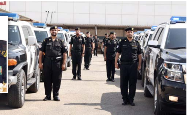
الدوريات الأمنية خلال انطلاق عملها في عفيف.

ولفت إلى أن الدوريات الأمنية في المملكة قطعت أشواطاً كبيرة في التطور والتوسع، إذ تتخطى بعطائها وخدماتها الأمنية إلى تقديم العون والمساعدة