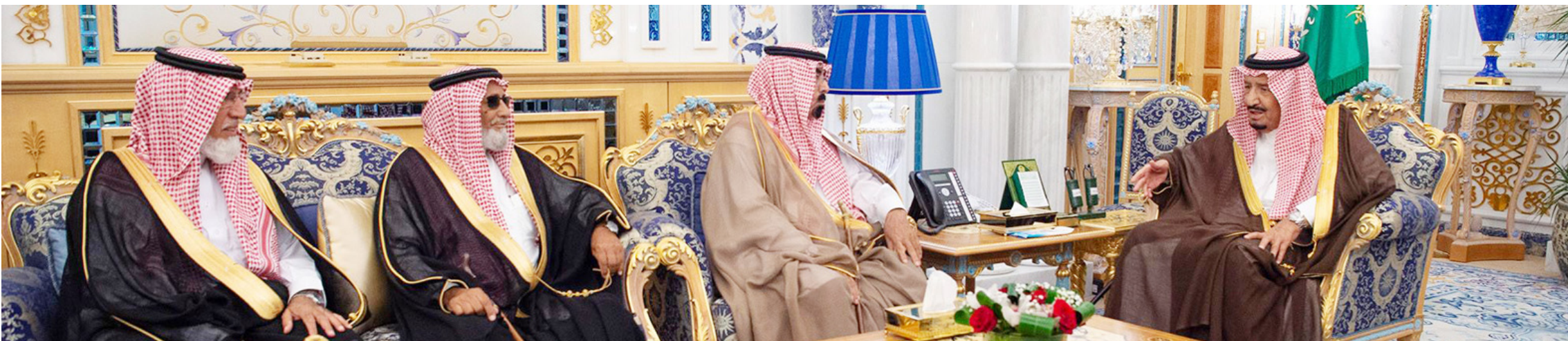
خادم الحرمين خلال استقباليه أسرة الفغم.