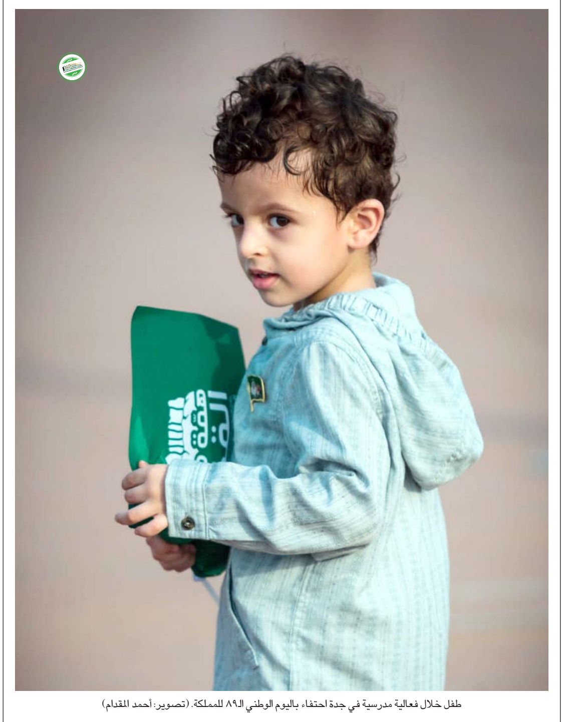
طفل خلال فعالية مدرسية في جدة احتفاء باليوم الوطني ٨٩ للمملكة.

«عكاظ» (الرياض) @okaz_online ٢٠١٩. مثل المملكة في هذه المسابقة، فريق CRED التابع لمركز التميز لأمن المعلومات، وكانت البلد العربي الوحيد ضمن ١٤ فريقاً عالمياً من مختلف الدول. وحظيت المشاركة السعودية بحضور متميز ويعد Hardwear.io مؤتمراً عالمياً مختصاً بأمن المعلومات يحظى برعاية ودعم شركات ومنظمات تقنية كبرى مثل شركة قوقل Google والمركز الهولندي لأمن المعلومات في لاهاي. في المسابقة العالمية، التي ركزت على عدة مجالات في أمن المعلومات أهمها: الهندسة العكسية للأجهزة الإلكترونية، اختراقات أنظمة السيارات، البلوتوث، والهندسة العكسية للبرامج الثابتة في الأجهزة الإلكترونية.