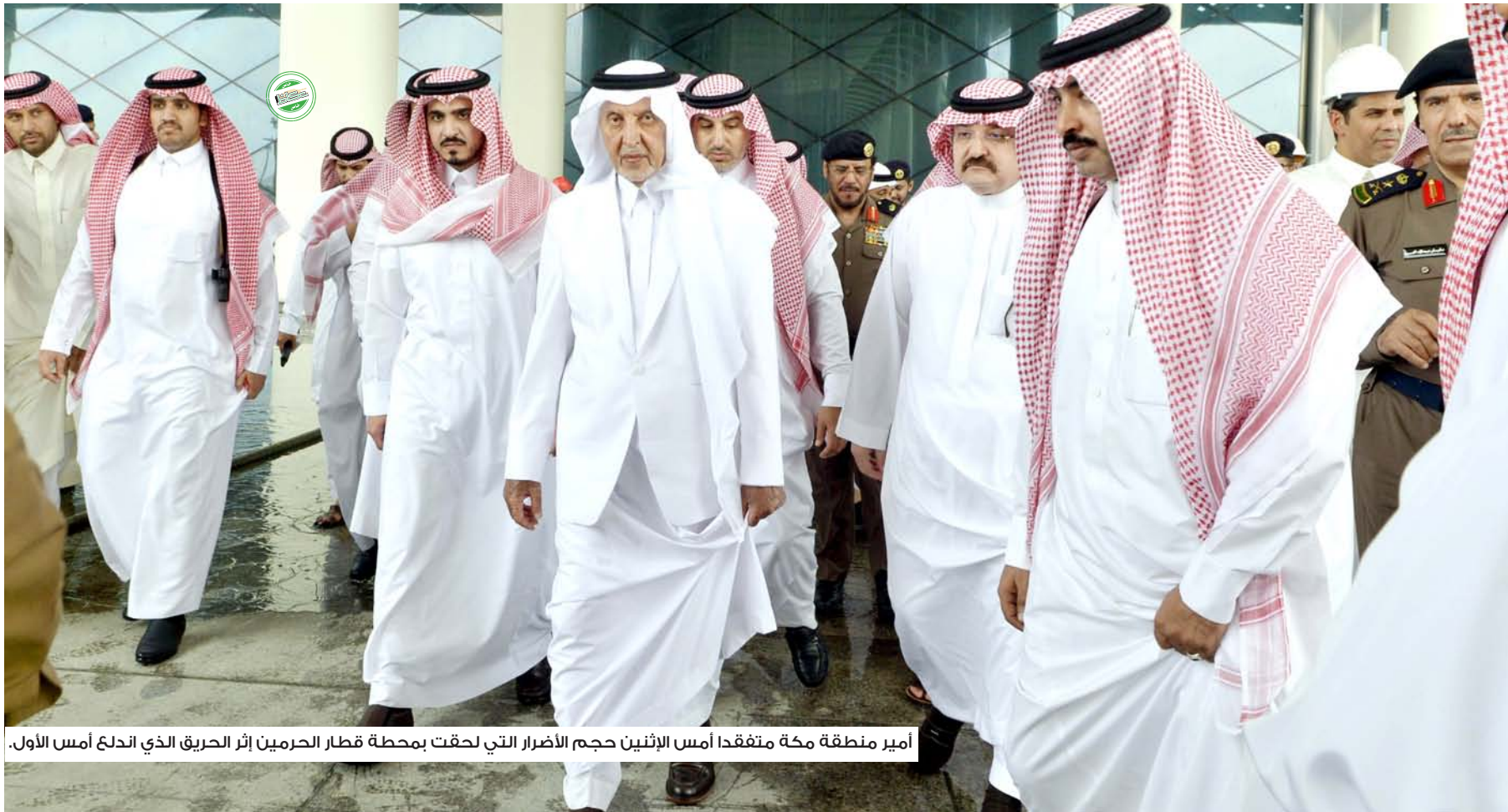
أمير منطقة مكة متفقدًا أمس الإثنين حجم الأضرار التي لحقت بمحطة قطار الحرمين إثر الحريق الذي اندلع أمس الأول.