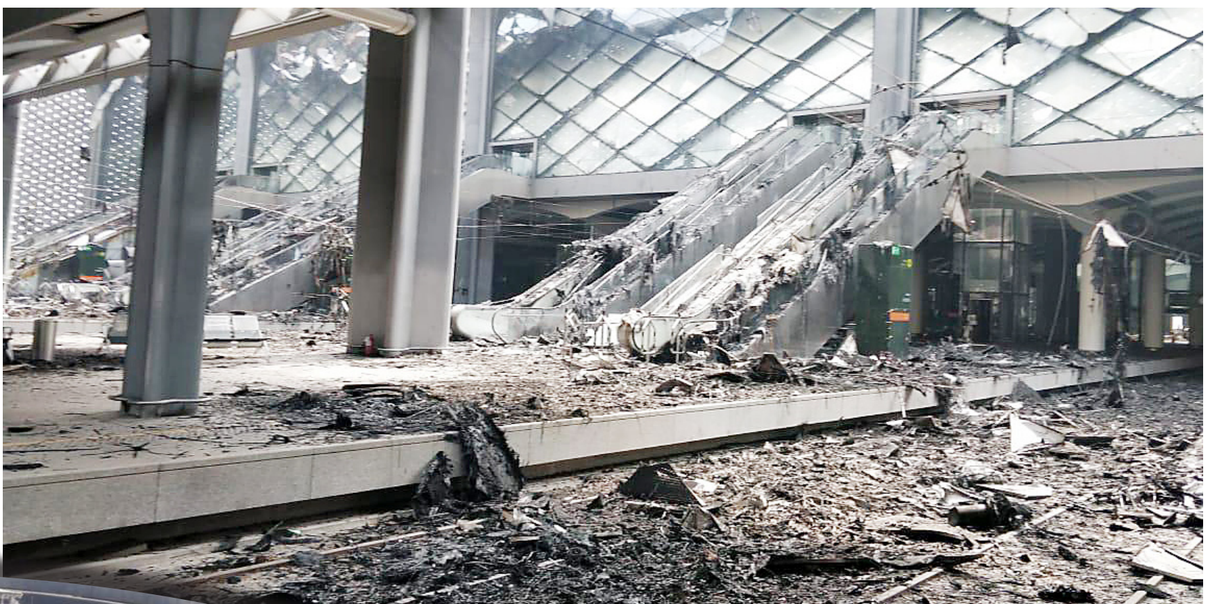
صورة متداولة لمحطة القطار كما بدت من الداخل.

وأكد مصدر لـ «عكاظ» أن البحث يجري عن تحديد سبب الحريق؛ إن كان ناتجاً عن تماس كهربائي أو اشتعال مواد بترولية، وهو ما يحتاج إلى وقت لفحص العينات التي حصلت عليها الأدلة الجنائية وخبراء الحرائق وتحليلها وإخضاعها للفحص المخبري الدقيق بواسطة أجهزة متطورة عالية الدقة. وتوقع المصدر أن تستغرق عملية تحليل العينات ٢٤ ساعة، موضحاً أن الدفاع المدني بجدة زود الخطوط الحديدية بتقرير مبدئي يتضمن قراءة أولية للمشهد، دون تحديد الأسباب.