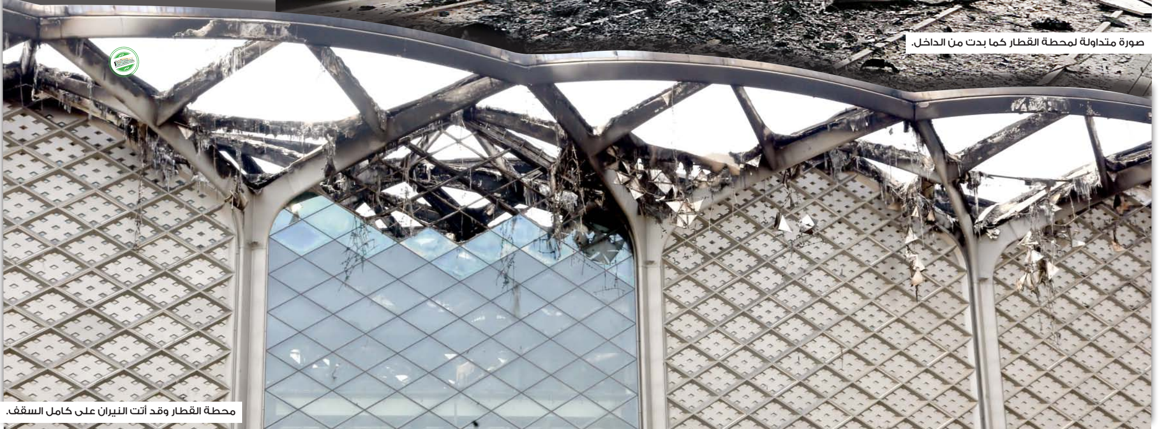
محطة القطار وقد أتت النيران على كامل السقف.