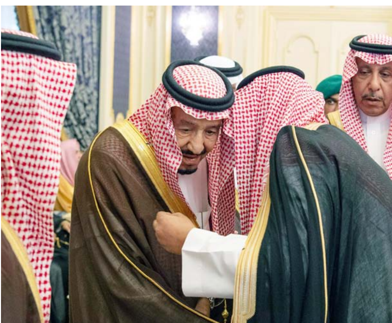
.. ومستمعا لأحد الحضور.