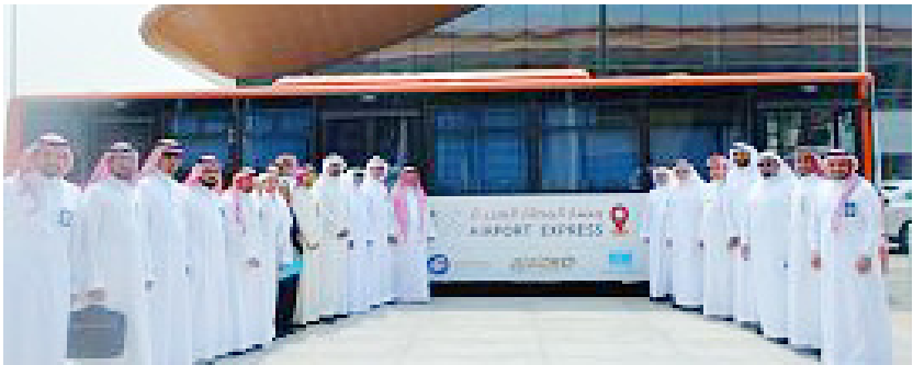
موقف خاص بحافلات النقل في منطقتي المغادرة والقدوم.

وقّعت الهيئة العامة للطيران المدني أمس (الاثنين)، مذكرة تفاهم مع شركة «مترو جدة» والشركة السعودية للنقل الجماعي «سابتكو»، بهدف تطوير التعاون في خدمات النقل في مطار الملك عبدالعزيز الدولي الصالة رقم (١) وتوفير أفضل الخدمات لخدمة جميع شرائح المجتمع وإتاحة خيارات متنوعة للمسافرين للتنقل من المطار وإليه. وبيّنت الهيئة أنها ستقوم بتخصيص موقف خاص بحافلات النقل في منطقتي المغادرة والقدوم في مطار الملك عبدالعزيز الدولي صالة رقم (١)، علاوة على تخصيص مساحة لإنشاء محطة انتظار أمام المواقع المخصصة لوقوف الحافلات بمنطقة القدوم، كما ستمكن الهيئة شركة «مترو جدة» أو من يمثلها من القيام بدورها في متابعة أداء الخدمة وما