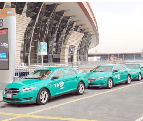
صورة متداولة لتاكسي المطار الأخضر.

ويأتي إطلاق الهوية الجديدة لتاكسي المطار مبادرة من الطيران المدني، وسعياً لتطوير العمل التجاري بمطارات المملكة، وإحداث النقلة النوعية في مستوى الخدمة والجودة التي يطمح لها مستخدمو المطارات بالمملكة وزوارها، وتشمل تلك المبادرات إنشاء وتشغيل صالات الطيران الخاص في مطارات (الملك عبدالعزيز، والملك خالد، والملك فهد) الدولية؛ لاستقطاب الشركات العالمية الرائدة في مجال الطيران الخاص، وتشغيل مواقف المطارات وفق أعلى المستويات.