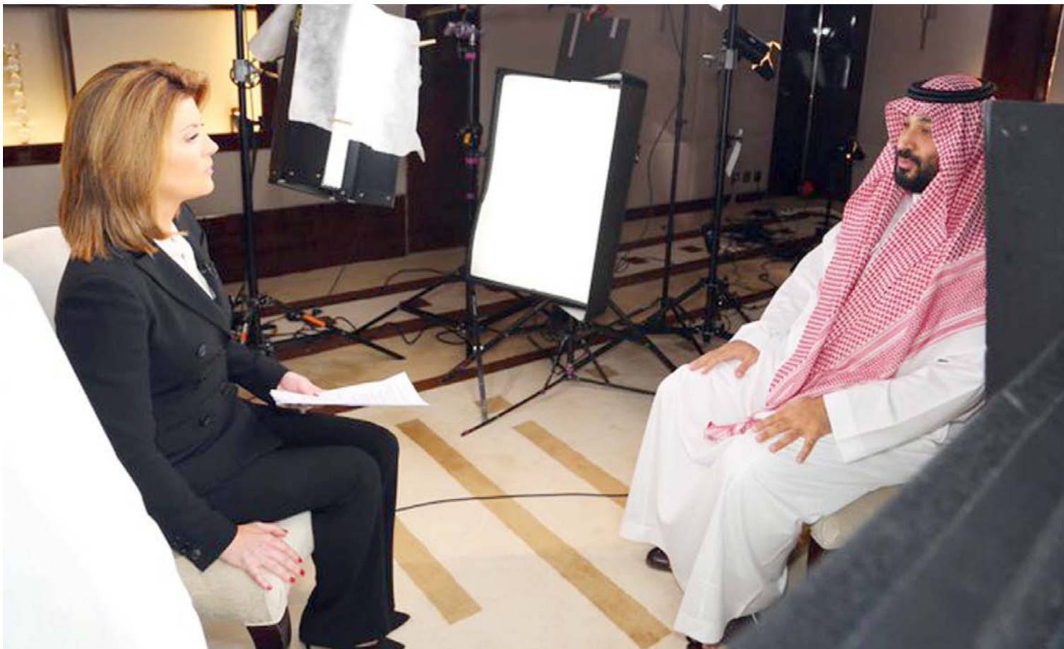
الأمير محمد بن سلمان خلال لقائه قناة cbs الأمريكية.