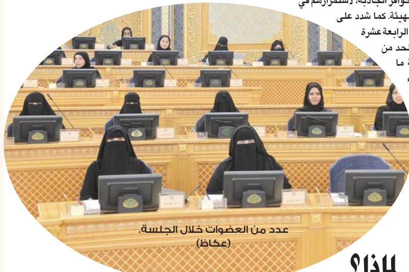
عدد من العضوات خلال الجلسة، (عكاظ)

معالجة الانبعاثات الغازية الناتجة عن الوقود المستخدم من قبل شركة الكهرباء وذلك للحد من الآثار السلبية على البيئة ويحث إمكانية الحصول على وقود صديق للبيئة، وهي توصية إضافية تقدم بها إلى المجلس عضو المجلس الدكتور هادي اليامي. الفاتورة الشهرية في حال كان سبب زيادة تلك المبالغ من قبل الشركة نفسها ووضع البية عادية لتعويض المتضررين والإسراع في وضع الآلية المناسبة لحساب تعريفة الطاقة المصدرة للشركة من استخدام الطاقة الشمسية الكهروضوئية الصغيرة والتوسع في تدريب موظفيها في مجال تنظيم الخدمات وتقديم الجوافر الجاذبة، لاستمرارهم في أداء وظائفهم لدى الهيئة كما شدد على الهيئة بتفعيل المادة الرابعة عشرة من نظام الكهرباء للحد من المخالفات وبخاصة ما يتعلق منها ببدء المقاولين والعمل قبل الحصول على ترخيص وعدم الالتزام بأشراطات الأمن والسلامة. وطالب المجلس الوزارة بدراسة