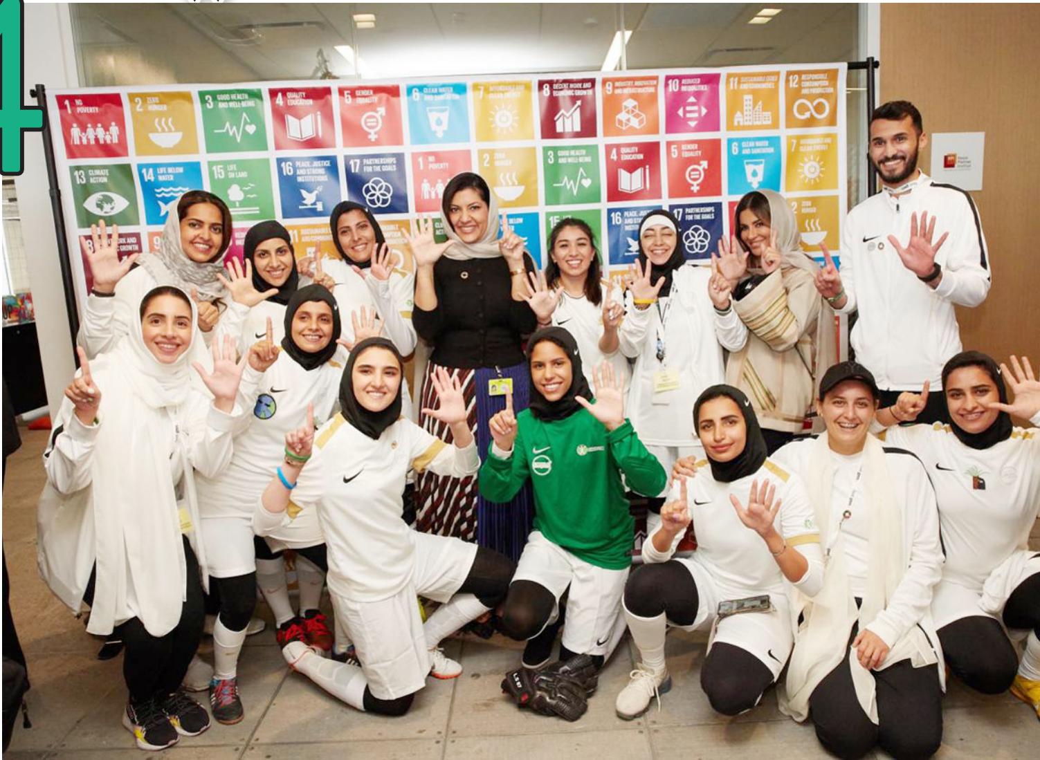
الأميرة ريما بنت بندر تتوسط لاعبات عقب تتويجهن.