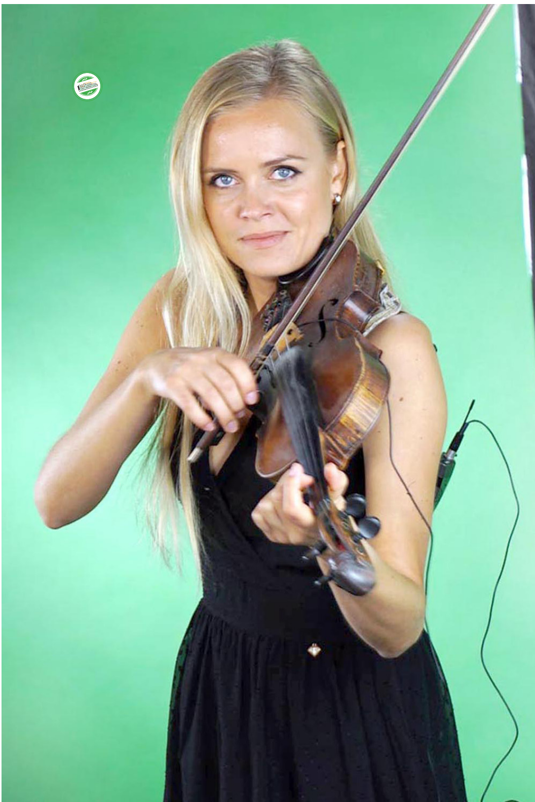
سيدة تعزف على الكمان أثناء جلسة تصوير مخصصة لتعليم الأطفال ضمن فعاليات معرض التصوير العالمي اكسبوجر الذي اختتمت فعالياته الأحد الماضي في الشارقة.

والمجتمع الدولي يتحمل مسؤولية التعامل مع الاعتداءات الإيرانية على جيرانها وتدخلاتها في المنطقة ودعمها للإرهاب والمترقة الذين يقاثلون باسمها في بؤر النزاع الإقليمية؛ إطلالة الأمير من نافذة أحد أهم البرامج التلفزيونية الأمريكية وأعلامها في نسب المشاهدة لا شك أنها كانت إيجابية لإيصال الرسائل السعودية وتصحيح التشويه الذي سعت الدعاية المنظمة لبعض القوى المعادية إقليمياً ودولياً لاستهداف المملكة به!