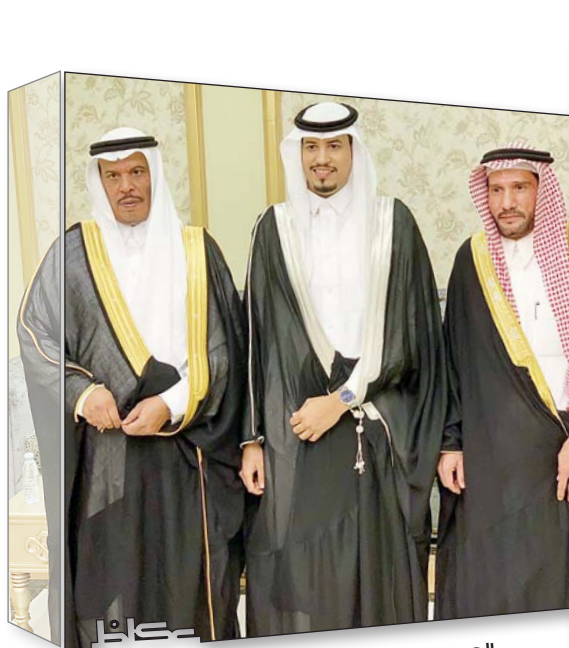
العريس متوسطا والده ووالد العروس