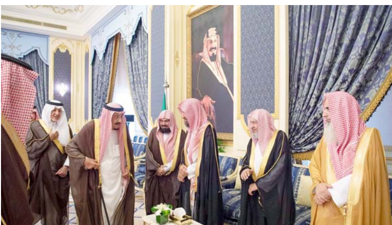
الملك سلمان أثناء استقباليه جمعا من العلماء.