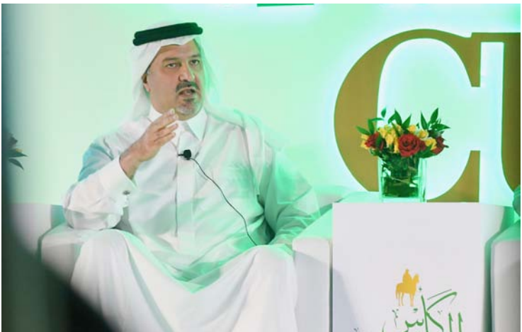
الامير بندر بن خالد متحدًا في حفل التدشين.

دعم سباقات الخيل العربية الأصيلة، من خلال تنظيم وإدراج ٤ أشواط بميدان الملك عبدالعزيز بالجنادرية في كل من كاس ولي العهد، وكاس خادم الحرمين الشريفين، وحفل كاس السعودية، وكاس المؤسس، موضحاً أن هذه الفعالية تنظم للمرة الأولى على مستوى المملكة، وأن المبادرة الثانية تتمثل في دعم ميادين سباقات الخيل المعتمدة بمبلغ ١٠ ملايين و ٢٠٠ ألف ريال.