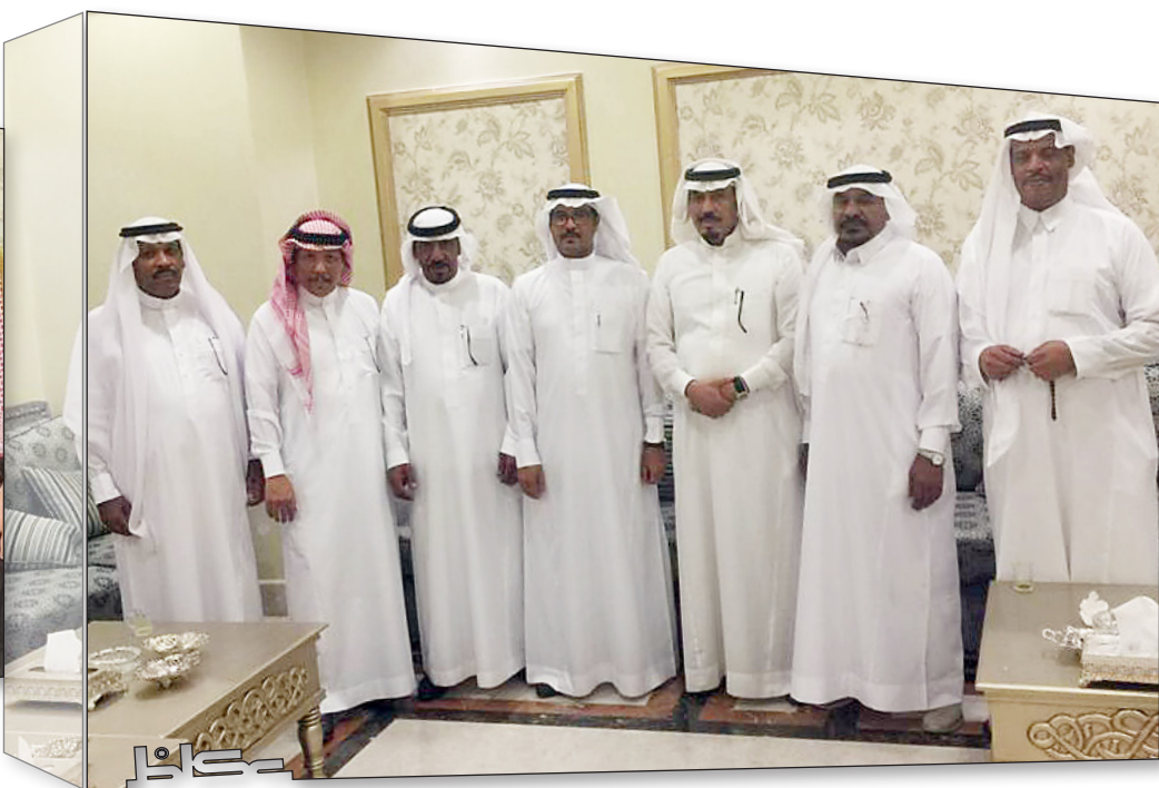
والد العريس وعدد من الضيوف.