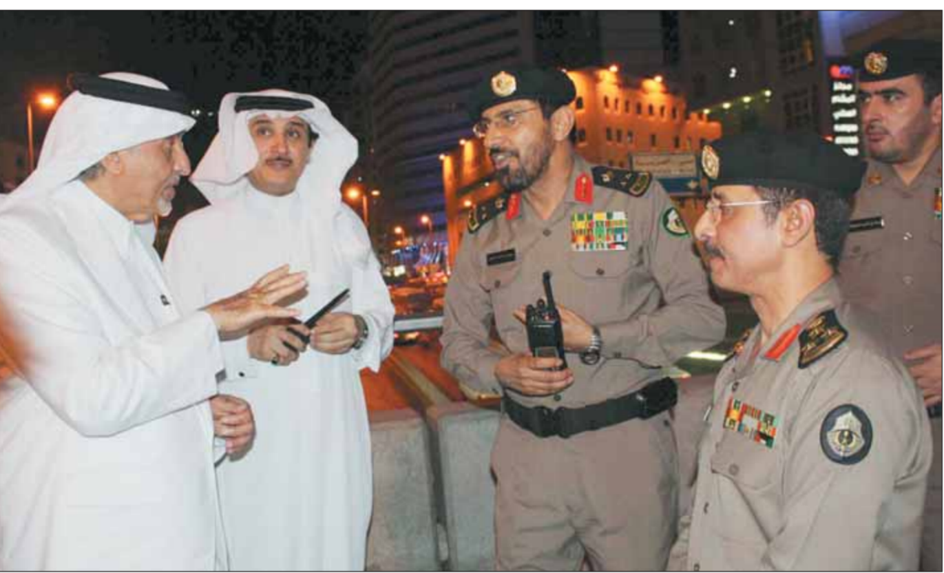
الأمير خالد الفيصل يناقش تنفيذ الخطة الترددية في منطقة أجياد في مكة المكرمة مع اللواء سليمان العجلان، والعميد إبراهيم المحزي وبيبدو وكيل إمارة مكة د. عبد العزيز الخضيري

خالد الفيصل يلتقي المهنيين أول أيام العيد واس، مكة المكرمة يلتقي صاحب السمو الملكي الأمير خالد الفيصل أمير منطقة مكة المكرمة مسؤولي ومواطنين في منزله في حي الميادين في جدة، عقب صلاة المغرب