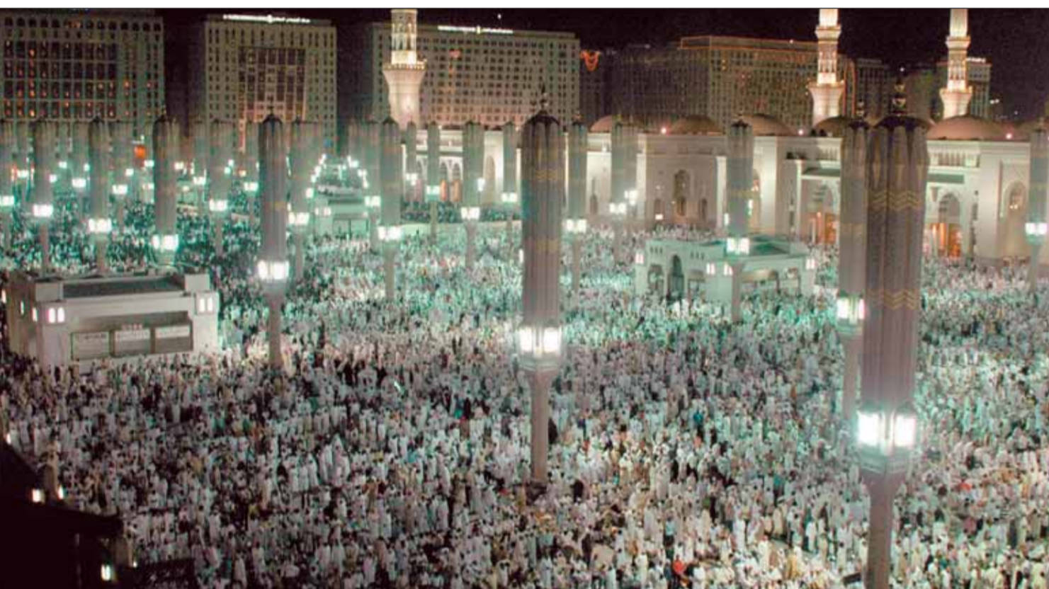
المسجد النبوي الشريف كما بنا الباحة ليلة ختم القرآن الكريم مكتظاً بالمصلين.

خالد الفيصل يلتقي المهنيين أول أيام العيد واس، مكة المكرمة يلتقي صاحب السمو الملكي الأمير خالد الفيصل أمير منطقة مكة المكرمة مسؤولي ومواطنين في منزله في حي الميادين في جدة، عقب صلاة المغرب